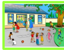
Cour de récréation